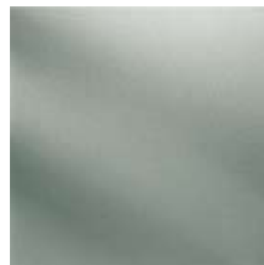
311V / NT (R9)