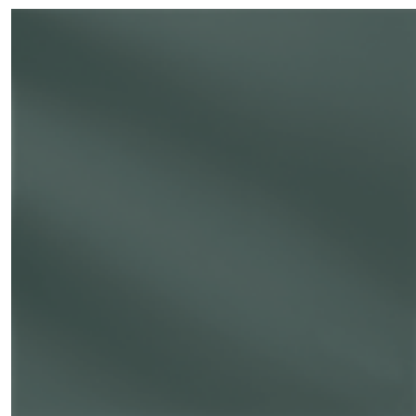
303V / NT (R9)