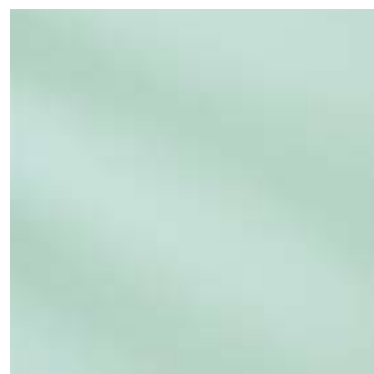
301V / NT (R9) 304V / NT (R10)