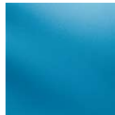
314V / NT (R9)