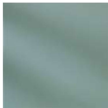
302V / NT (R9) 305V / NT (R10)