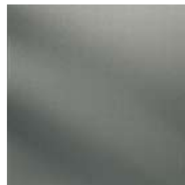
312V / NT (R9)