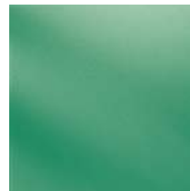
315V / NT (R9)