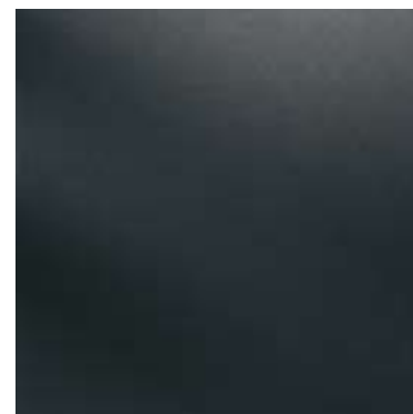
313V / NT (R9)